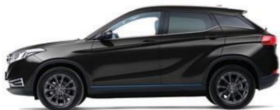
Черный – металл