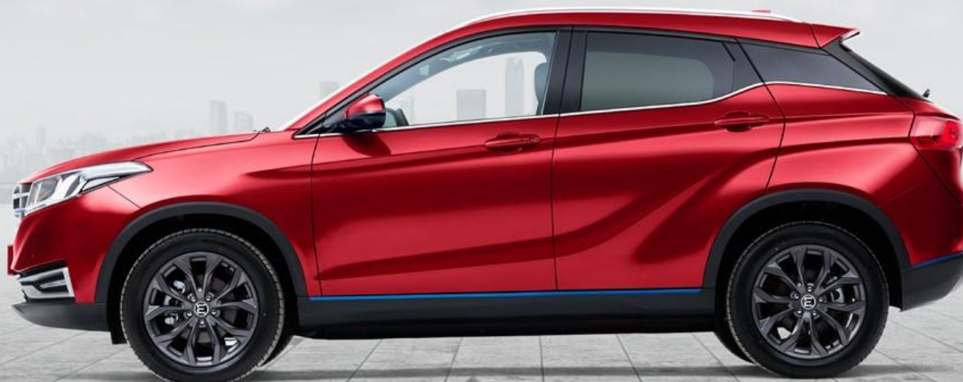
Красный – металл