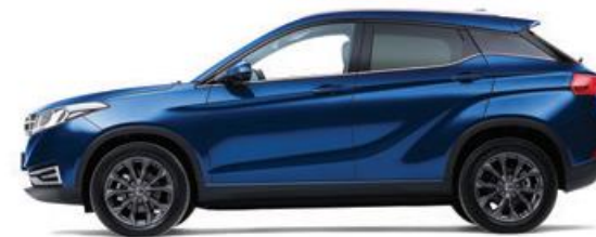
Синий – металл